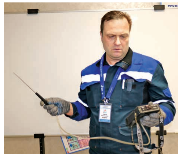
Окончание. Начало на 1-й стр.

Практические задания команды выполняли на следующий день в техническом классе ПУ «Кобрингаз». В соответствии с вводной участники конкурса при проведении полного технического обслуживания квартиры выполняли работы по подключению котла и его пусконаладке, а также ремонт и комплекс работ по определению технического состояния варочной панели. Учитывались не только результаты работы и соблюдение правил безопасности и охраны труда, но и полнота, и очередность проводимых процедур, руководящая роль мастера и даже затраченное на выполнение задания время.