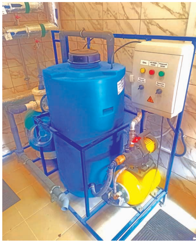
Установка очистки оборотной воды

Очищенную воду рекомендуется использовать при предварительном и основном циклах мойки с последующим