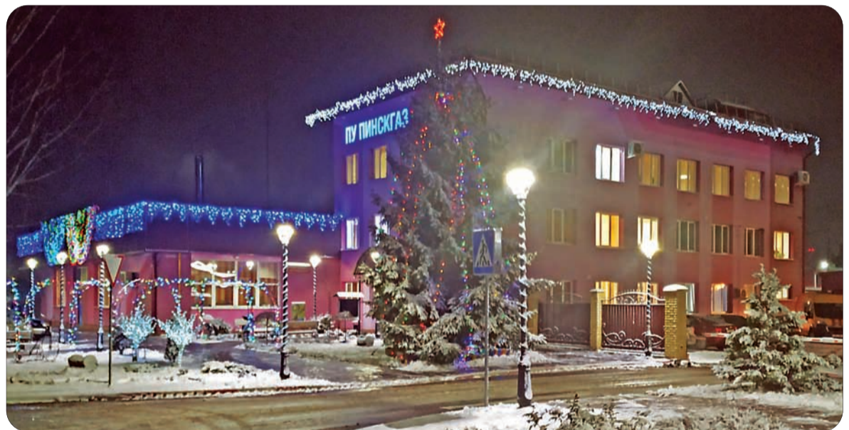
2-е место – ПУ «Пинскгаз»