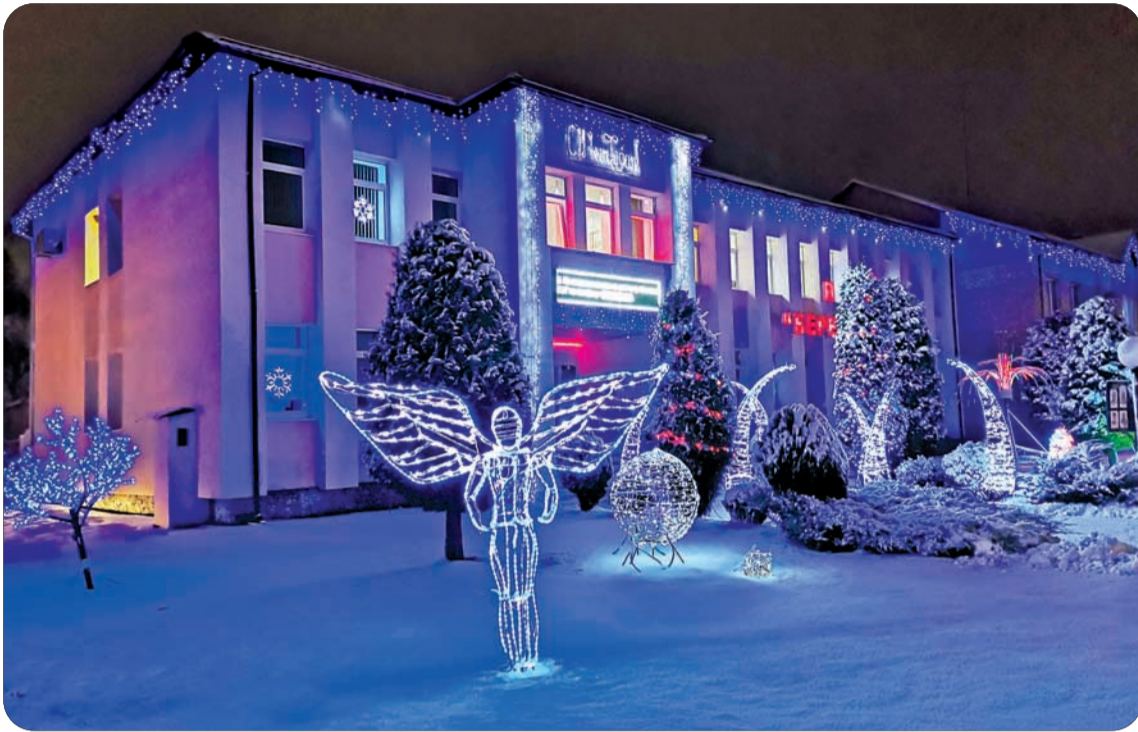
1-е место – ПУ «Берёзагаз»