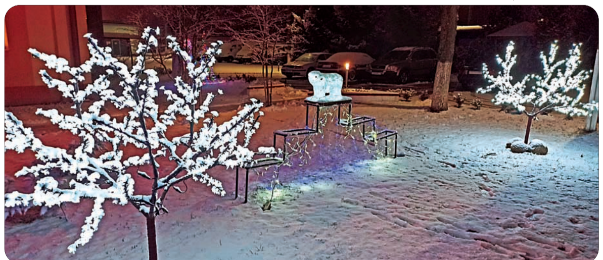
3-е место – Ивацевичский РГС