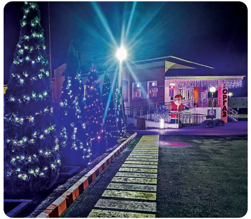
2-е место – ПУ «Пинскгаз»

Новый год – это не только пушистые ёлки, подарки и праздничный стол, но и празднично оформленные витрины, украшенные яркими растяжками проспекты, сияющие разноцветными лампочками здания. В этом году почти везде отменили массовые гулянья, рождественские ярмарки и корпоративы. Но просто гулять по городу и любоваться праздничной иллюминацией никто не запрещал, тем более что посмотреть есть на что. Празднично украшенные улицы белорусских городов радуют глаз новогодними огнями и яркими ёлками. Именно эти чудо-светлячки, несмотря на отсутствие снега, создавали нам праздничную новогоднюю атмосферу, поднимали настроение.