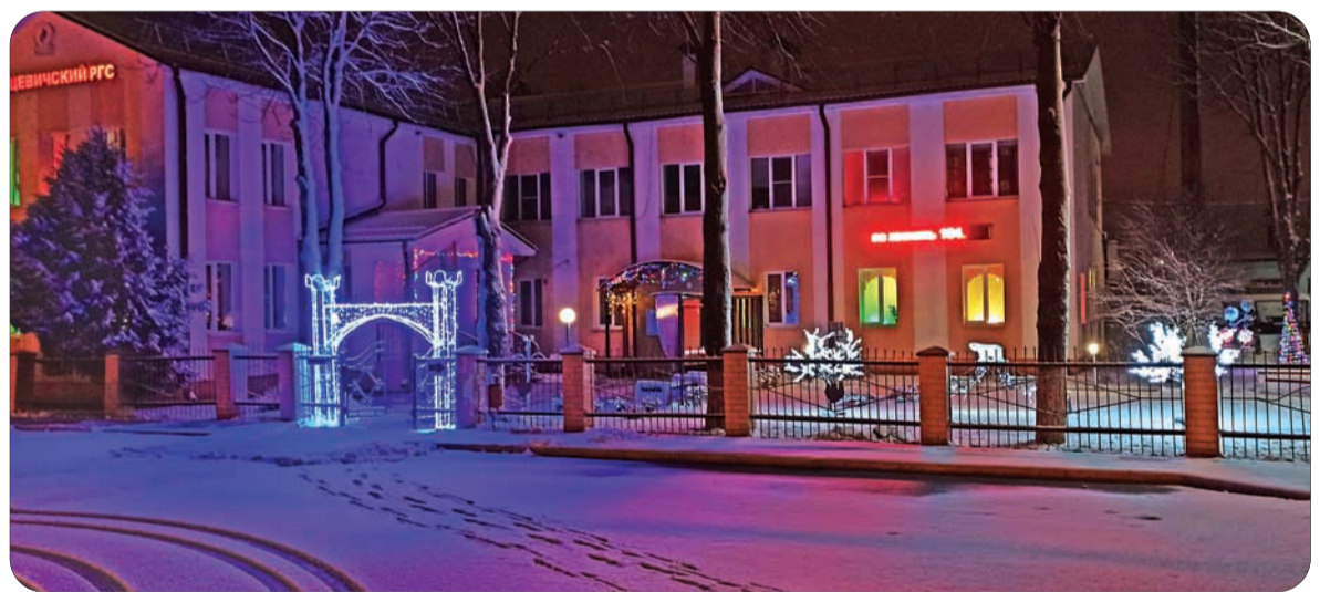
3-е место – Ивацевичский РГС