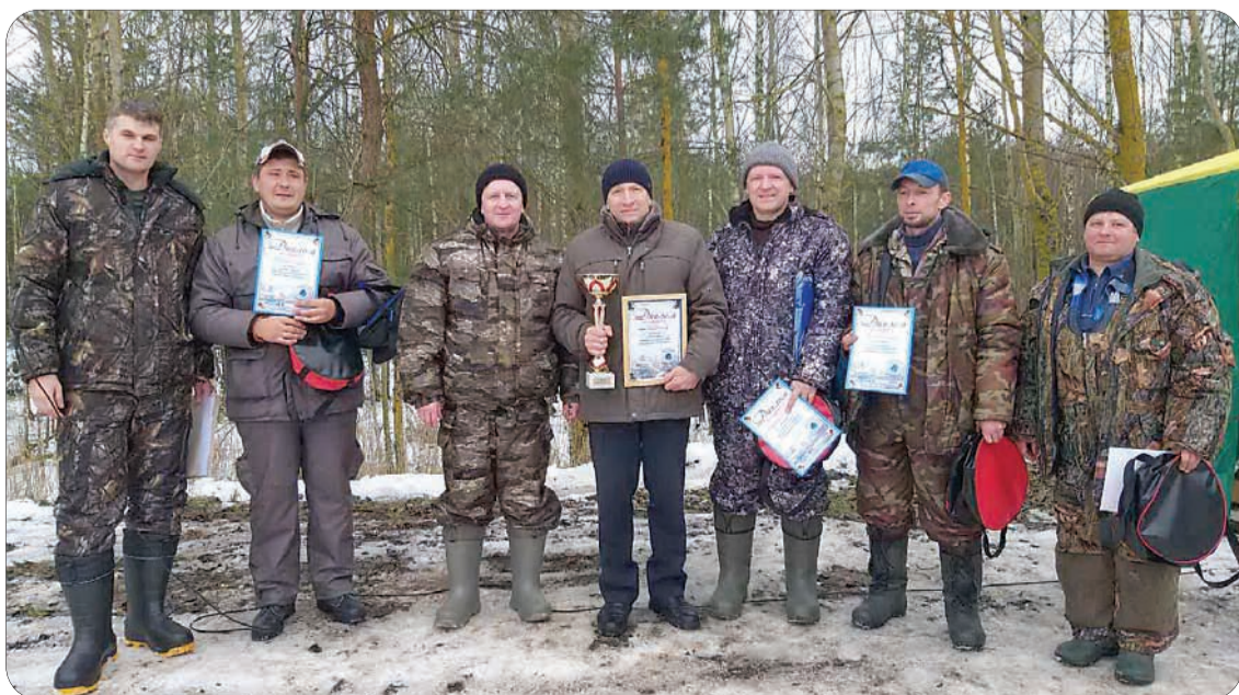
Команда победителей – ПУ «Березагаз»

Долгожданный праздник пришел для любителей рыбной ловли и активного времяпровождения на свежем воздухе. Для них профсоюзная организация и администрация УП «Брестоблгаз» провела 23 января соревнования по зимнему спортивному лову рыбы. Все в этот день совпало: отличный солнечный день, крепкий лед, хороший клёв и улыбки на лицах соревнующихся.