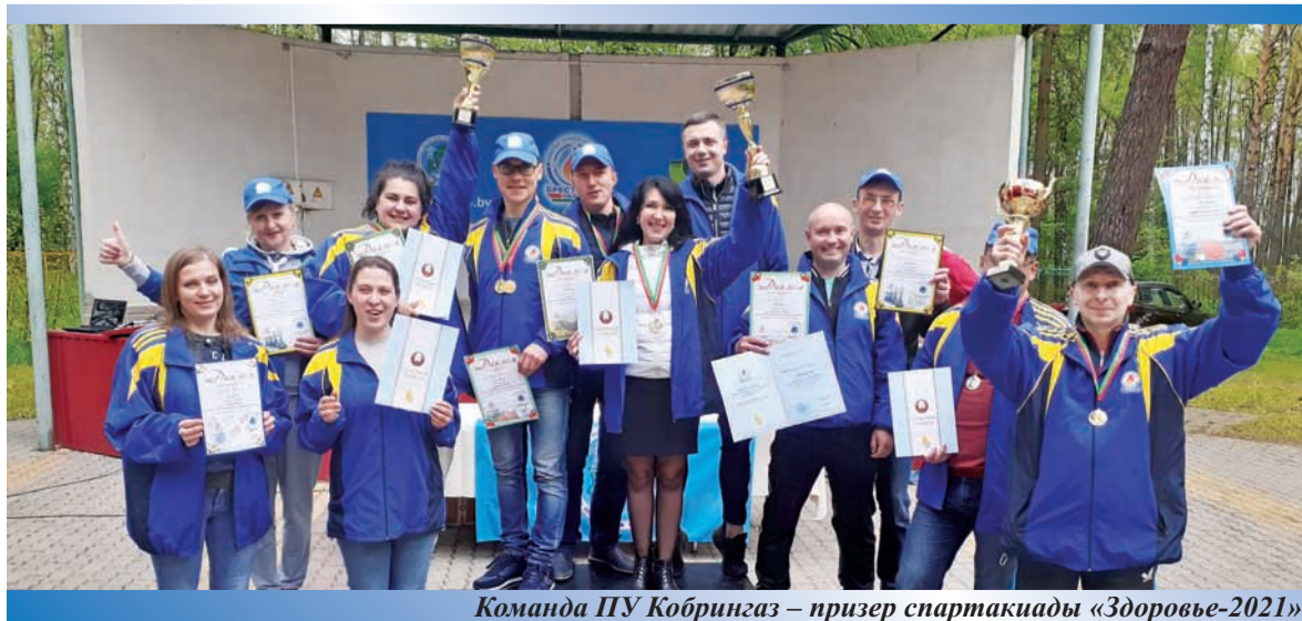
Команда ПУ Кобрингаз – призер спартакиады «Здоровье-2021»

На 2022 год перед нами поставлены напряженные задания по комплексному приборному обследованию подземных газопроводов (433,42 км), замене устаревшего бытового газового оборудования в жилом фонде (3485 шт.), техническому обследованию газовых котлов (6069 единиц), переводу жилых помещений с сжиженного на природный газ (65 квартир) и другие. Уверен, что благодаря накопленному опыту, высокому профессионализму, грамотному управлению, сплоченному коллективу предприятие выполнит все намеченные планы и показатели.