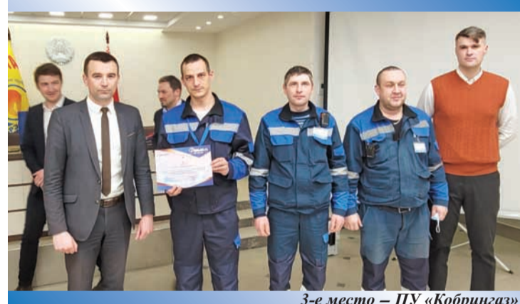
3-е место – ПУ «Кобрингаз»