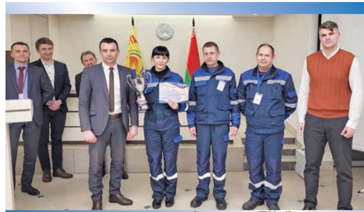
1-е место – ПУ «Барановичгаз»