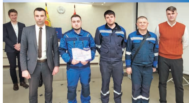
2-е место – ПУ «Брестгаз»