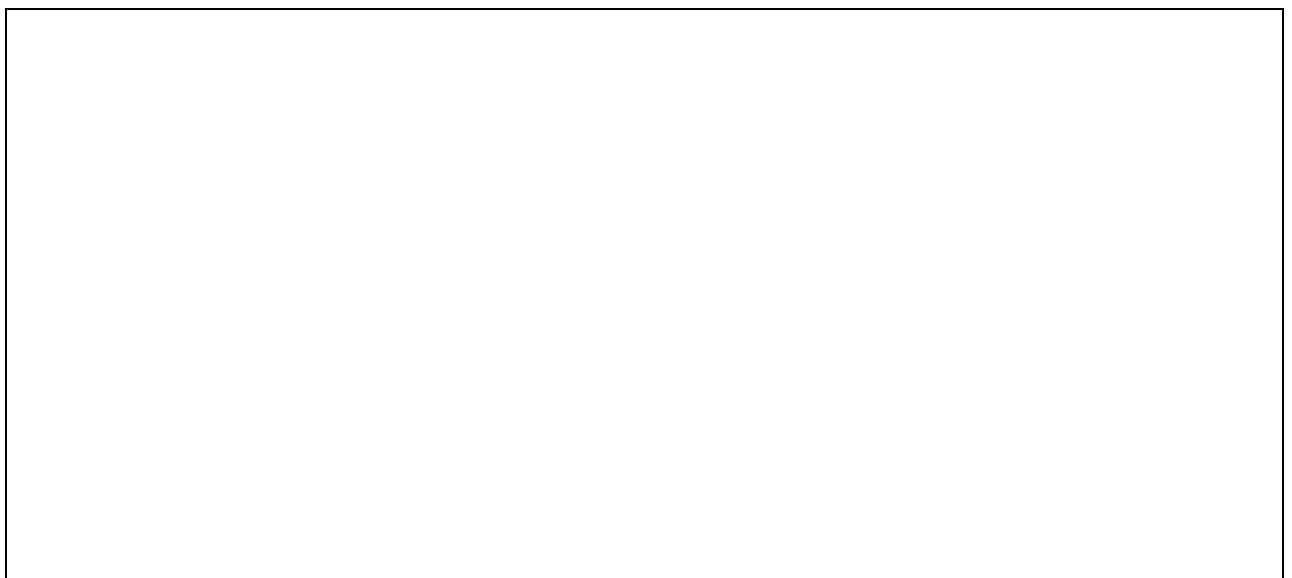
Схема монтажа ИБУ