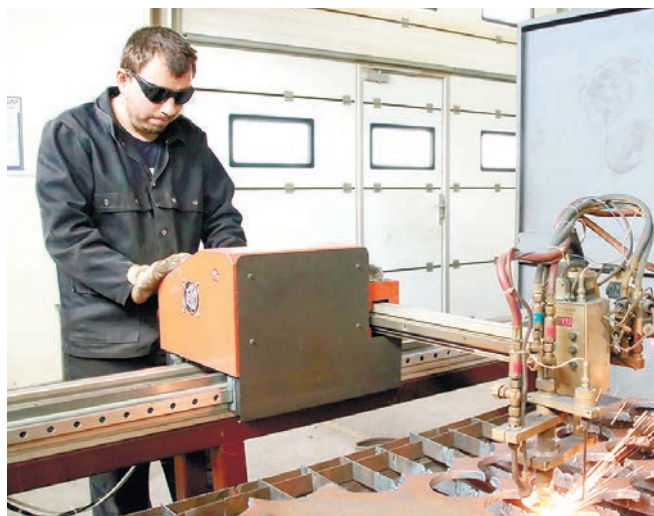
Новый станок плазменной резки металла уже в действии