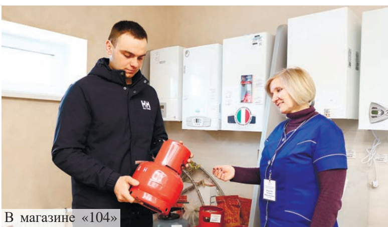
В магазине «104»