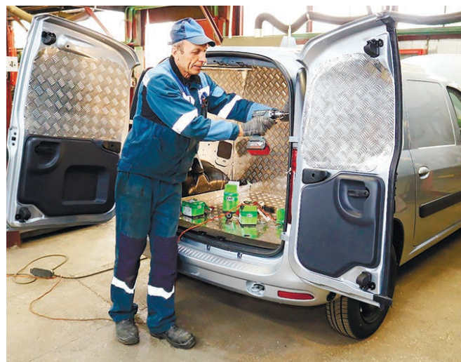
Переоборудование автотранспорта в РММ в Иваново