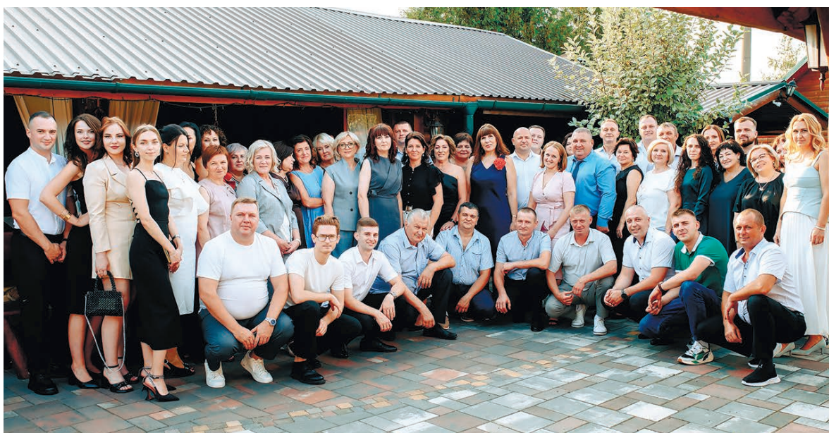
Коллектив ПУ «ПВД» на юбилейном торжестве

зайном и качеством производства специальной одежды самого требовательного клиента. Даже многие сторонние организации, узнав о данном производстве в УП «Брестоблгаз», стали нашими постоянными клиентами, например, РУП «Брестэнерго». В настоящее время наши швейники выполняют заказы УП «Гродноблгаз» и УП «Минскаблгаз», после чего приступят к изготовлению изделий для УП «МИНГАЗ» и ряда сельскохозяйственных предприятий, входящих в состав ГПО «Белтопгаз».