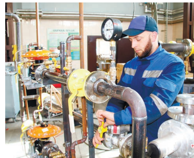
Производство изделий для систем газоснабжения в брестских РММ