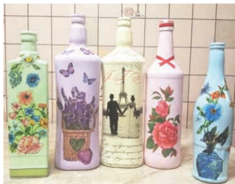
Вазы Инны Чаквиной